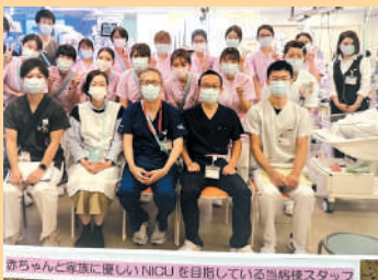
地域医療について意見交換を行う