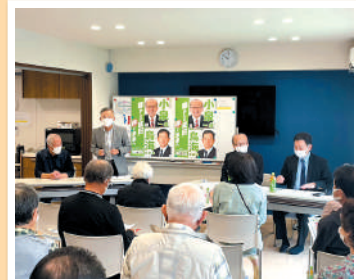
地域住民と一緒に学ぶ