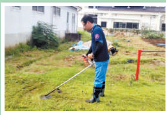
地区小学校 草刈り奉仕活動