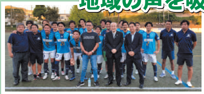
社会人サッカーチーム 成田ユナイテッド公式試合観戦

市内全域の様々なイベントに積極的に参加し地域の活動を目で見て感じ地域の声を吸い上げることを行う