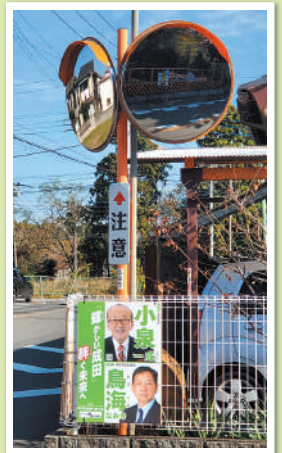
カーブミラー設置