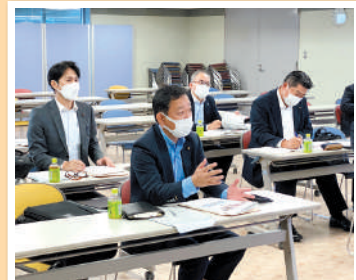
他自治体の先進事例を学ぶ