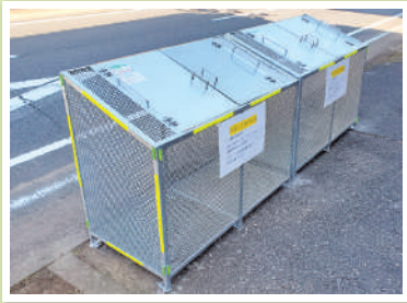
鉄製集積ボックスの設置