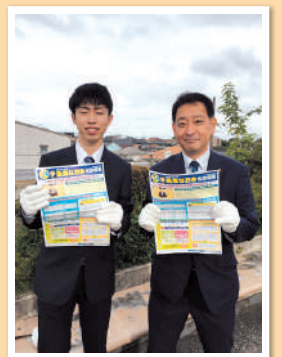
議員インターン生と一緒に学ぶ