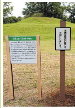
赤坂公園内 重要文化財の看板掲示