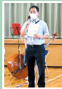
地区音楽祭イベント