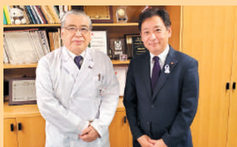
成田赤十字病院長との面談

本市においても成田赤十字病院と今後連携した取り組みが期待されます。低出生体重児として生まれてくる赤ちゃんは10人に1人という数値もあることから、安心して子どもが産めるまちづくりとしても世界早産児デー啓発の重要性を感じるものであります。