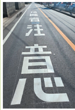
三里塚地先交通事故 多発地帯の路面標示施行