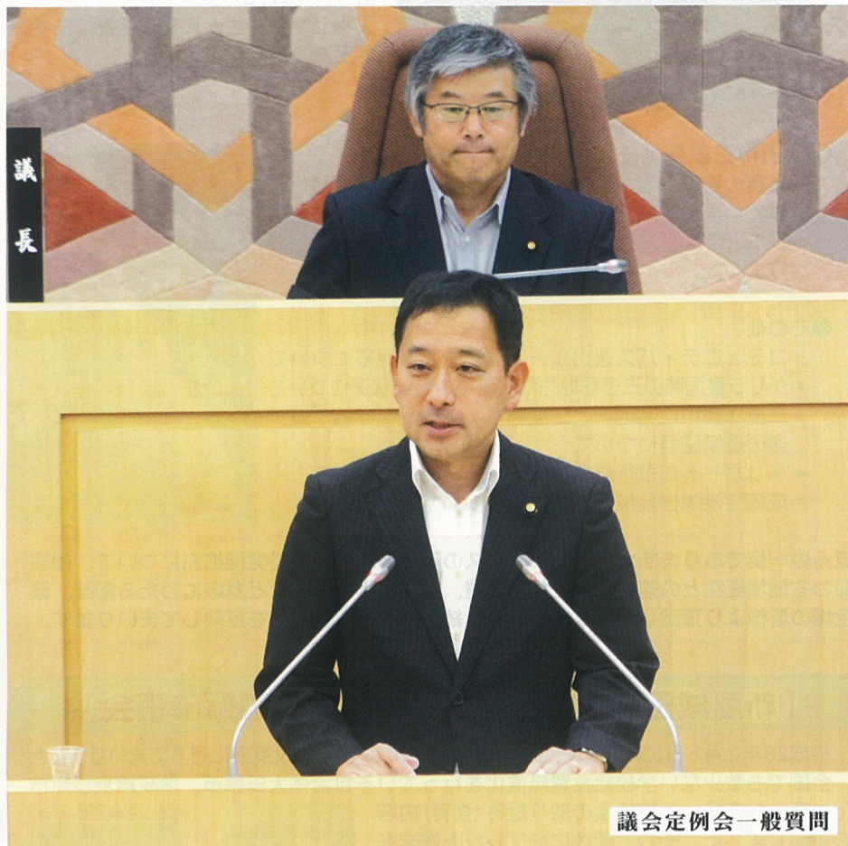
議会定例会一般質問